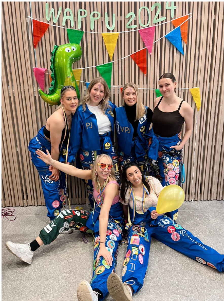
Terhon hallitus vapputunnelmissa Postitalolla.

Terhon ja Retikan yhteisiä liikuntavuoroja järjestetään viikoittain yliopiston liikuntatiloissa, ja niihin osallistuaksesi tarvitset SYKETTÄ-tarran (lisätietoa seuraavassa kappaleessa). Vuoroilla voidaan tehdä mitä tahansa laidasta laitaan kävijöiden toiveiden mukaan. Toissa keväänä järjestettiin ensimmäistä kertaa Terho x Retikka polttopalloturnaus, joka keräsi liikuntavuorolle runsaasti Terhoja ja Retikoita liikumaan. Tervetuloa mukaan!